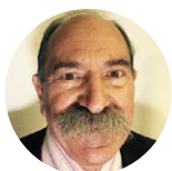
NAPISAL/A Marijan Zlobec

#fotografija , #umetnost , #smrt , #prvinovember